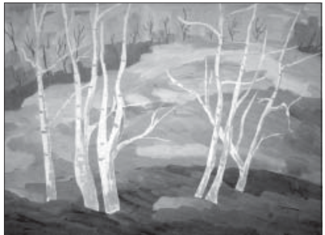
Zait Gheorghe - Peisaj

Știa că în iubire va afla sensul vieții, iubire pe care n-apucase s-o trăiască, dar pe care o simțea crescând în el, ca pe un nufăr ce se dezvoltă în apele aurii-verzui ale unui lac dintr-o țară exotica, îndepărtată și dorea să poată supraviețui acestei nefaste dureri ce-i acaparase trupul nevolnic. Din nou, auzi aceiași pași mărunți, precauți, parcă și o creangă mică, uscată, călcată neatent. Privi iar în ceața întunericului amestecat cu umbre nedesluite de arbori, care se lungeau pe caldarâm în lumina unor