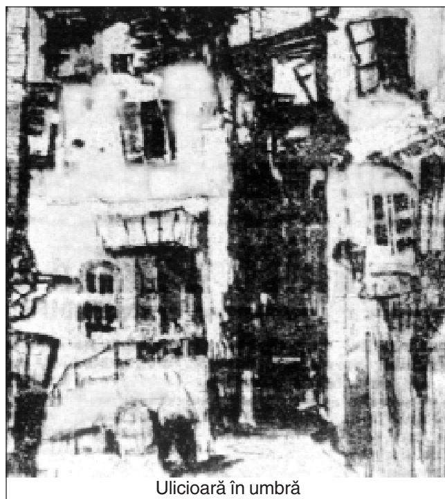
Ulicioară în umbră