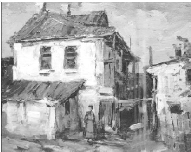
În fața porții