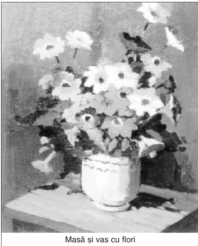
Masă și vas cu flori

lasă de izbeliște, în stare de restricție vitală maximă (împinsă până la pretinsele sinucideri, de fapt, instigări sociale la crimă/sinucidere) pe cei atrași de glasul de sirenă al „individualismului“.