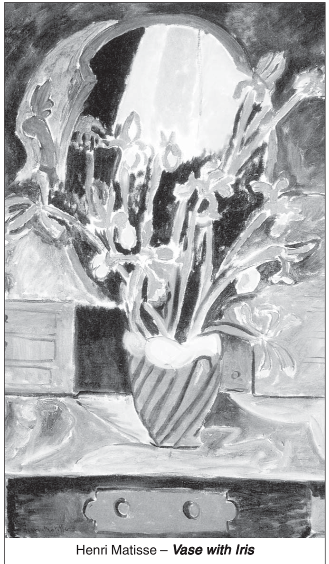
Henri Matisse – Vase with Iris