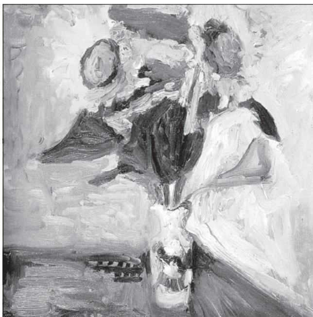
Henry Matisse – Vase of Sunflowers