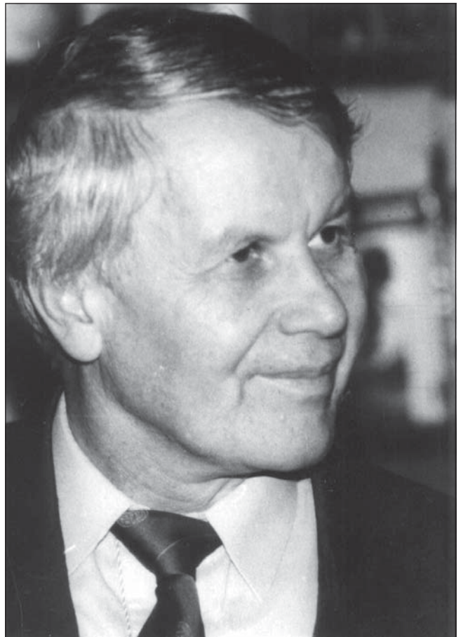
Eugen Simion.

Unanian observă atent noul mediu în care intră și notează (în fine, nu el, personajul, ci naratorul din spatele lui) modelul în care, în preajma morții, continuă nebuniile, zădărniciile și comediile lumii din afară. Avocatul Doda vrea pentru soția lui, moartă de mult, „flori mai potrivite“, ulei de măsline pentru candelă (ulei „numai franțuzesc“), și, în genere, vrea numai lucruri scumpe. „Nu mă uit la preț – spune el intendentului Unanian – vreau ca soția mea să aibă ce-i trebuie“. A avea ce-i trebuie pentru un mort este un lucru absurd. Dar absurdul este elementul pe care îl speculează prozatorul. Același avocat Doda dorește ca lumânările să fie de ceară curată, fără parafină,